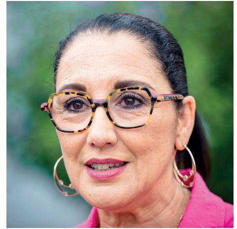
FADILA KHATTABI Ministre déléguée chargée des Personnes handicapées