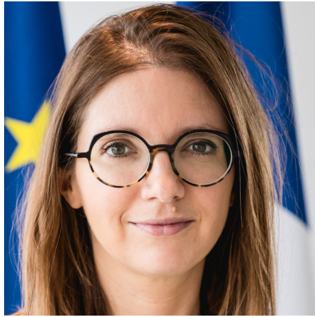
AUORE BERGÉ Ministre des Solidarités et des Familles