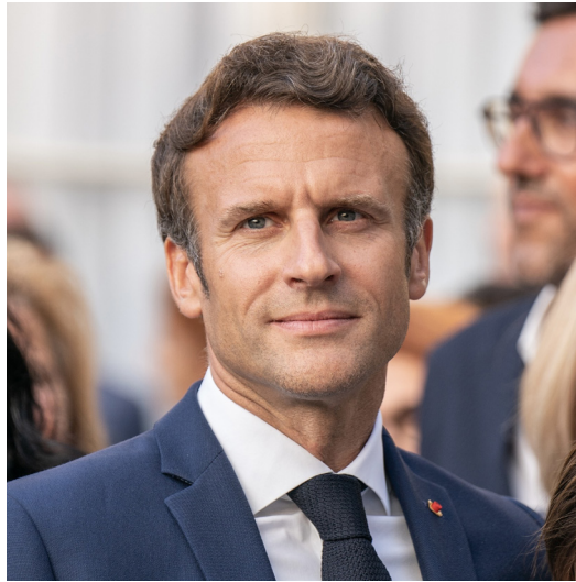
EMMANUEL MACRON Président de la République