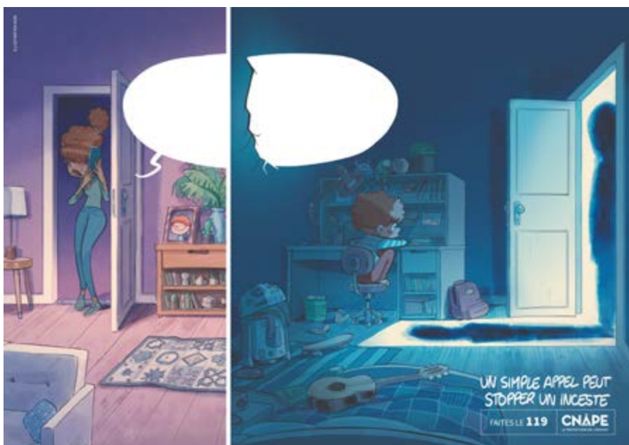
Illustration de NOB «Un simple appel peut stopper un inceste» dans le cadre de la campagne de la CNAPE contre les violences faites aux enfants. Plus d'informations sur cnape.fr .

par le grand public. Nous avons ainsi essayé de toucher les centres d'animation, les centres sociaux, les centres de protection maternelle et infantile, les pharmacies, les salles d'attente de cabinet médicaux. Le message fait encore peur et l'accueil n'a pas toujours été favorable, mais c'est là justement le sens de notre mission et de notre militantisme. ▲