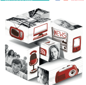
Les défis de l'éducation aux médias et à l'information