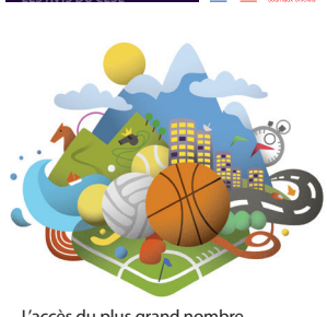
L'accès du plus grand nombre à la pratique d'activités physiques et sportives