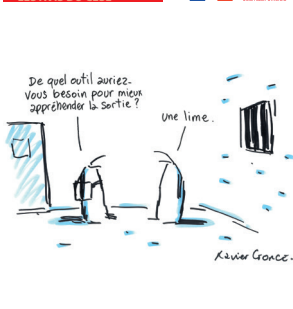
La réinsertion des personnes détenues : l'affaire de tous et toutes